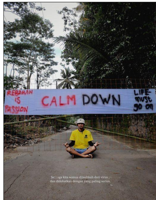
Gambar 1. Data 1

Tindak tutur direktif adalah adalah tindak tutur yang bertujuan menghasilkan efek berupa tindakan yang dilakukan oleh pendengar misalnya: memesan, memerintah, memohon, menuntut, menasihati, meminta, melarang, membolehkan, menanyakan, dan mengancam. Dalam ilustrasi berikut yang berkebaruan di media sosial terdapat tindak tutur direktif berupa meminta pendengar untuk dapat menaati prokes dan menasihatkan bahaya covid-19.