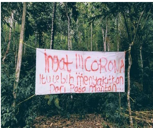
Gambar 2. Data 2 Narasi yang terdapat dalam spanduk yang beredar di Facebook ini menunjukkan

Tindak tutur direktif yang lain yang dinyatakan dengan maksud menyuruh atau memberikan imbauan bisa dilihat dari gambar di bawah ini.