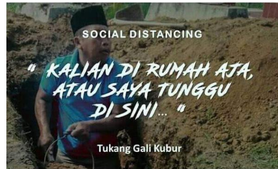
Gambar 6. Data 6

oleh istri selama isolasi berlangsung. Tentu ini menjadi hiburan sekaligus peringatan keras yang dapat menyugesti pembaca untuk dapat menghindarkan diri dari virus corona.