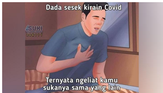
Gambar 3. Data 3

Pada meme di atas terdapat narasi sebagai berikut "Dada sesek kirain covid . Ternyata ngeliat kamu sukanya sama yang lain". Narasi di atas bisa dimaknai sebagai sebuah tuturan yang mengekspresikan harapan kepada pembaca tentang rasa sakit di dada ketika melihat orang yang dikasihi telah berbahagia bersama yang lain. Namun, di sisi yang lain narasi dalam meme di atas juga diperuntukkan sebagai tuturan yang memberi nasihat dan penjelasan terkait gejala awal seseorang didiagnosa menderita covid-19 dengan tanda sesak di dada. Narasi bernada rayuan ini telah disukai dan dikomentari ribuan oleh warganet yang sekaligus menjadi hiburan di tengah kondisi pandemi yang sulit ini. Hiburan lewat bahasa dalam meme saat ini sangat penting untuk menjaga kesehatan mental masyarakat dan berupaya selalu tersenyum agar imun tubuh tetap terjaga.